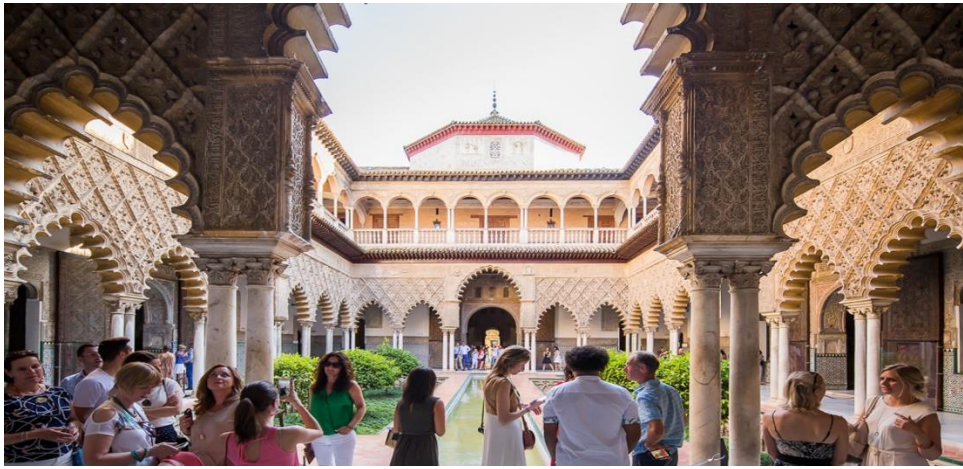
Patio de las Doncellas. Real Alcázar de Sevilla

Sevilla (Ayuntamiento): La ciudad de Sevilla es uno de los grandes referentes del turismo en España. Su centro histórico, y más concretamente el Espacio Central del destino, se constituye en el principal escenario turístico de la ciudad y, por tanto, el que recibe una mayor afluencia turística. En el marco del presente Plan se pretende actuar en aquellos espacios de máxima aglomeración turística, caracterizados por una configuración urbana de calles estrechas en la que la actividad turística convive con la población local. El objetivo general del Plan es convertir a Sevilla en un laboratorio de sostenibilidad e inteligencia turística de centros históricos de turismo urbano, generando conocimiento y diseñando herramientas transferibles.